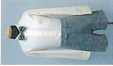
男生恤褲 連 Bow 呔