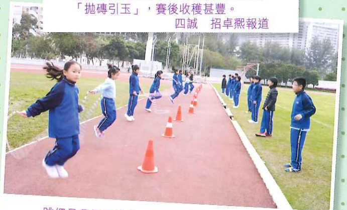
跳繩是我們的強項，「跳跳虎」也要甘拜下風呢！ 五望 林在晴報道