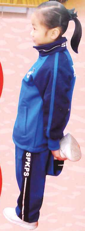
從「單腳企」的活動中，讓學生領略何謂「堅毅」精神。