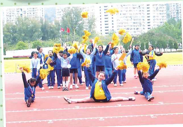
啦啦隊各自為本社運動員落力打氣，功架十足呢！ 四信 郭穎報道