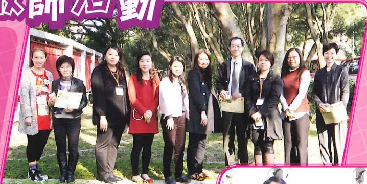
家教會委員與校長及兩位副校長於環保生態園合照留念。