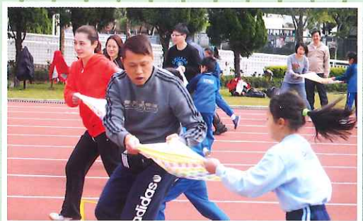
在親子競技比賽中，家長和子女合力「拋磚引玉」，賽後收穫甚豐。 四誠 招卓熙報道