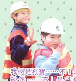
我們是孖寶……不！是 砂煲……不！是笨煲 (TROUBLE)兄弟才對！ 四望 李念情報道

我們這班來自四至六年級的校園小記者，為大家現場直擊報道第十五屆陸運會的精采花絮，讓健兒們的英姿活現在光影和文字裏。