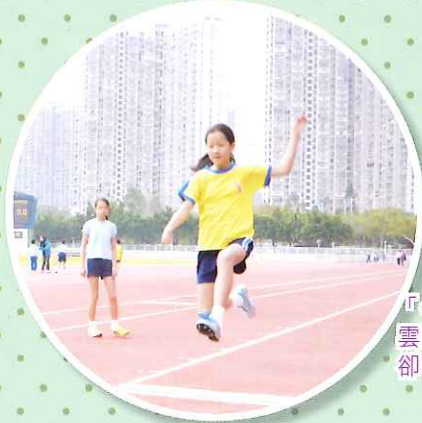
「各位觀眾，且看我的『梯雲縱』」……年紀輕輕，卻輕功了得，佩服，佩服！ 五望 湛晞彤報道

我們這班來自四至六年級的校園小記者，為大家現場直擊報道第十五屆陸運會的精采花絮，讓健兒們的英姿活現在光影和文字裏。