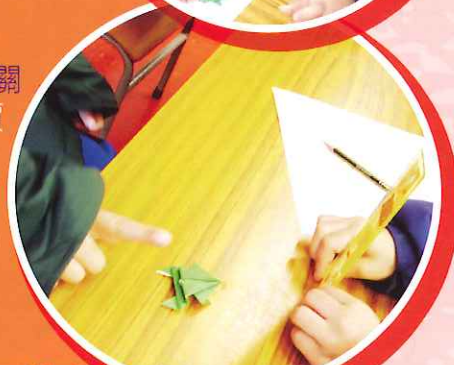
再透過故事中的主角——跌入井中的青蛙，讓學生體驗「堅毅」精神的重要性，從而反思如何在學習中實踐「堅毅」的情操。