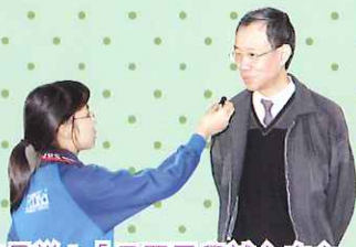
校長說：『只要同學誠心向主耶穌祈禱，你們的所求就必得成全。這次運動會能在燦爛的陽光下舉行，實在要感謝神！』 六信 彭紀琳報道