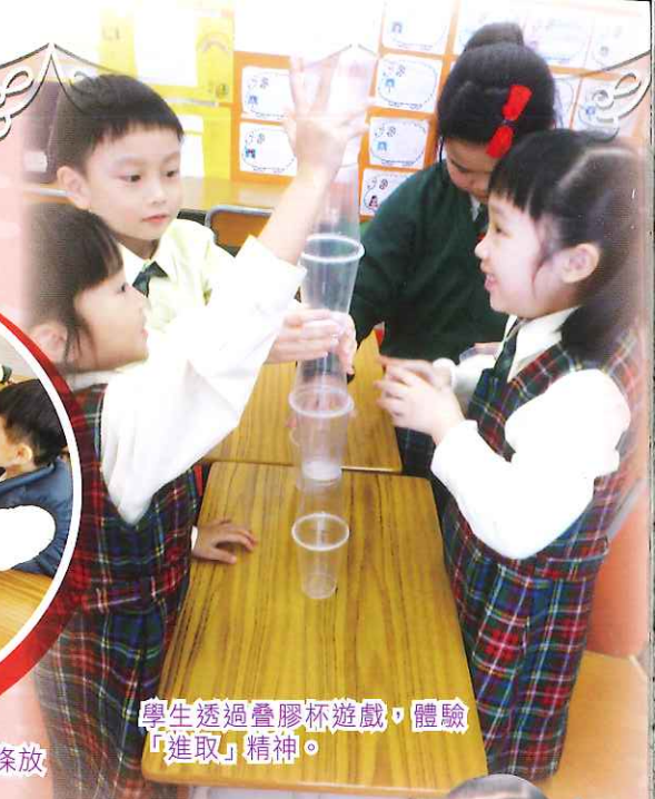
學生透過疊膠杯遊戲，體驗「進取」精神。