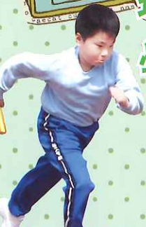
「跑得快，好世界； 跑得麼，冇鼻哥。」 五望 黃日朗報道