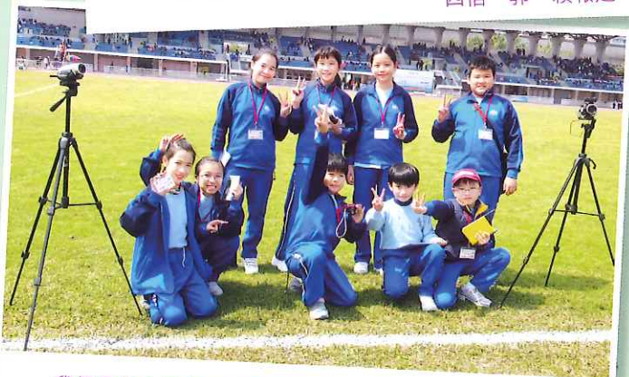
我們是誰？答案可在右面的名單中找到。請多多指教！ 四望 鄧立天報道