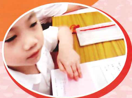
一年級同學能活學活用，運用課堂上學到的知識，轉化成行動，向祖母送上心意卡，以表達對祖母的關心。