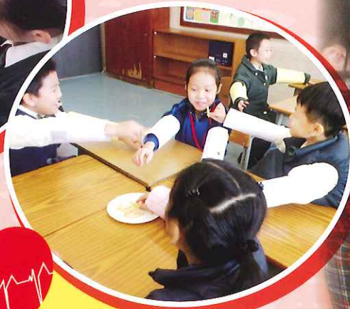
雙手帶上手套，不能彎曲手臂把蝦條放入內，如何是好？同學們想到互相幫助，發揮「關愛」的精神，這便可以一起分享美食了。