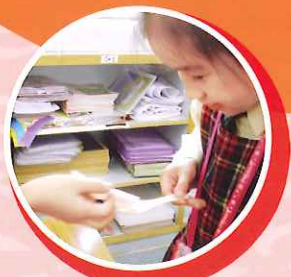
成功傳送容易折斷的粉筆真不容易！透過遊戲，引發學生思考：如果一個人的骨骼像粉筆一樣易碎，她要怎樣面對生活？