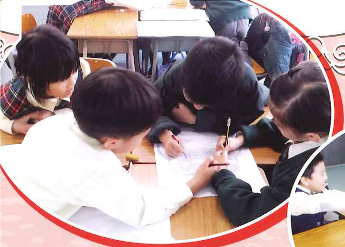
齊齊構思「主動關心別人」的行動方案。