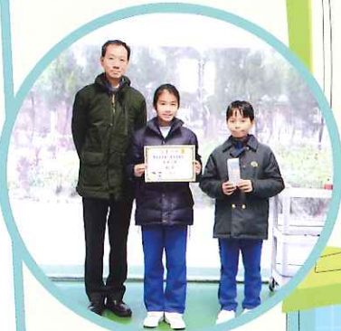
校長頒獎給清潔比賽冠軍得獎者。

則： 組老師就各班的整潔情況和能 行五常法（常清潔、常整頓）而在 紙上給分和簽署。 分為五個等級：5分是最高，1 最低，如該班的整潔情況惡劣， 零分。 每紙以星期為單位，每週作統計和 彙。