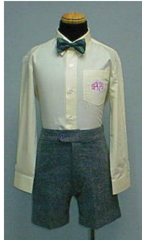
男生恤褲 連 Bow 吹